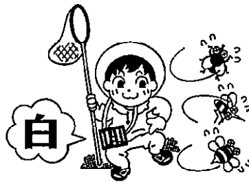
長そで・長ズボン・白っぽい服を着よう