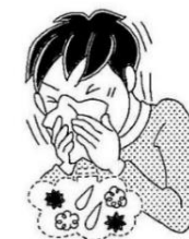
ハンカチやティッシュで覆う