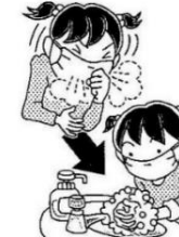
せきやくしゃみをした後は手を洗う