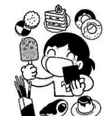
甘いものばかり食べている

急に気温が下がる日が多くなってきました。寒暖差の影響や乾燥、気圧の影響で咳が出やすくなることもあります。ひどくなる前に早めに受診しましょう。