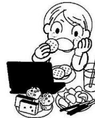
ダラダラ食べている