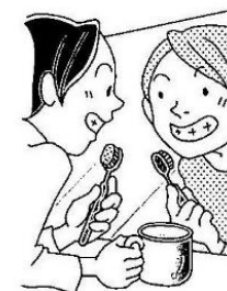
鏡を見ながらみがく