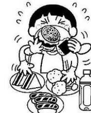
よくかんでいない